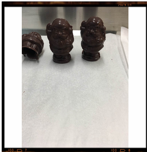
Le premier bilan.