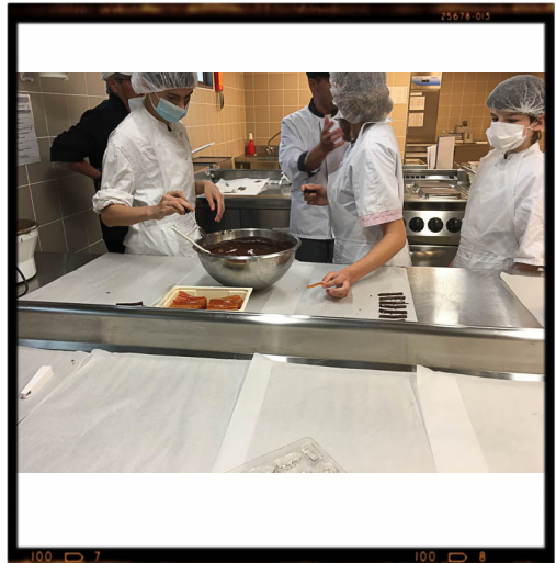
Cuisine, chocolat, confexion ! La rigueur !