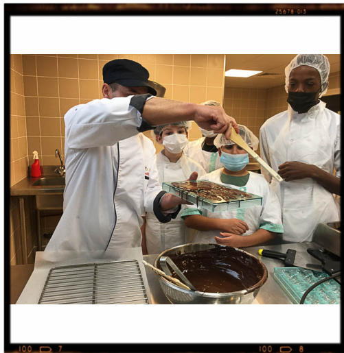
Productions en quinconce : orangette noir ou au lait, figurines 2D ou 3D.