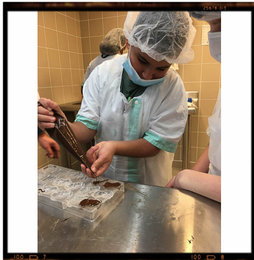
La pratique spécifique.